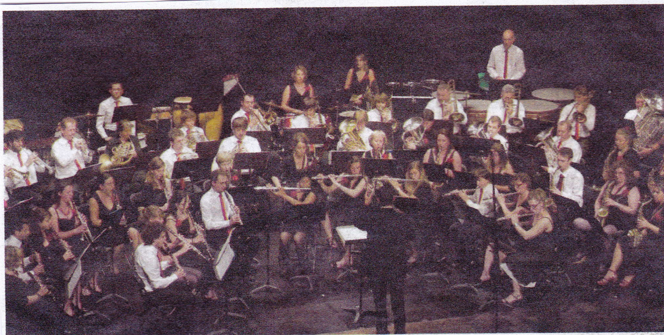
Les musiciens de l'Orchestre d'harmonie du Pays de Gex.