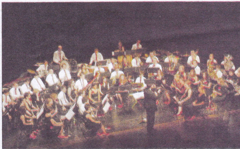
"Pierre et le loup" est le gros projet de l'année pour l'Orchestre d'harmonie du pays de Gex.

avec de l'improvisation et un classique des harmonies qui s'inspire des danses roumaines sont aussi au programme.